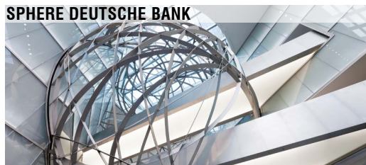
Mario Bellini, Mailand Frankfurt, 2011