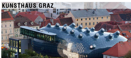
spacelab UK P. Cook, C.Fournier, London Graz/Österreich, 2003