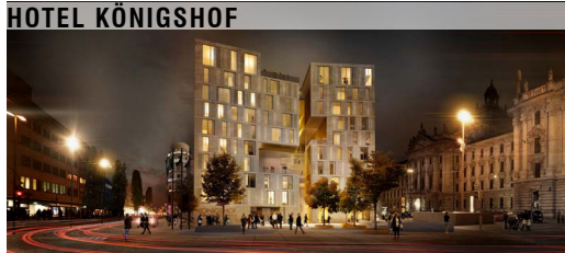
Nieto Sobejano Arquitectos, Madrid, Berlin in Planung