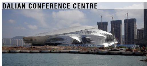
Coop Himmelb(l)au, Wien Da Lian/China, 2013